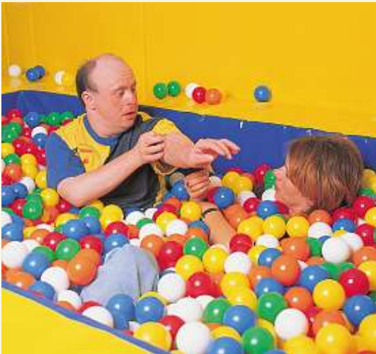
Spass und Körperwahrnehmung im Kugelbad

Natürliche Menschlichkeit und Originalität sind uns Ansporn und Kraft