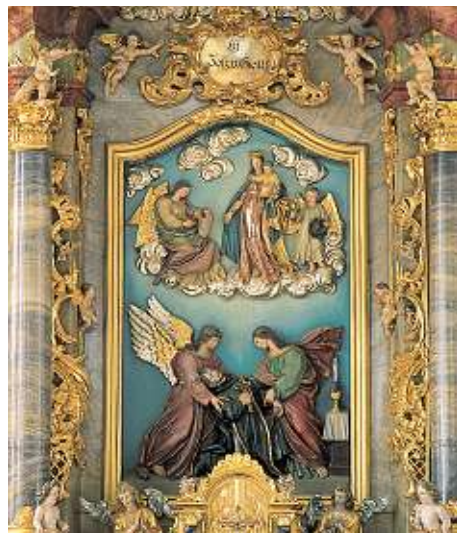
Tod des heiligen Johannes von Gott – Altarbild in der Hauskapelle