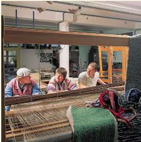
Die Weberei der Werkstatt für Behinderte

Christliches Menschenbild erlebbar und lebbar machen