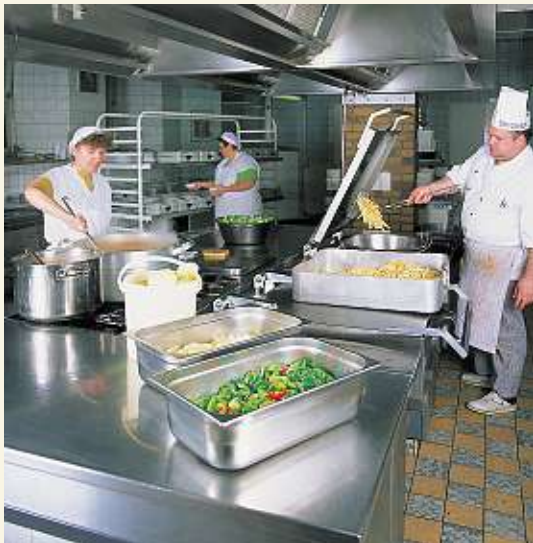
Die Küche – einer der vielen Bereiche, der für das Wohl der in der Einrichtung lebenden und arbeitenden Menschen sorgt.

Lösungen zu finden. In unserer Einrichtung arbeiten Mitarbeiterinnen und Mitarbeiter aus unterschiedlichen Berufsgruppen (25). Jede/r bringt ihre/seine speziellen Fachkenntnisse ein. Dadurch und durch gegenseitiges Lernen profitieren wir voneinander und steigern die Qualität unserer Arbeit.