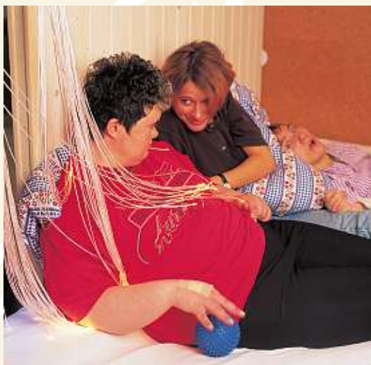
Sich entspannen im Snoezelen-Raum

Der Begriff „Leitbild“ ist noch sehr jung, die Sache allerdings, um die es geht, hat Tradition. Sie läuft unter Begriffen wie Ideale, Visionen und Ziele. Gemeint sind Vorstellungen, nach denen Menschen ihr Handeln ausrichten, gedachte Zustände und Formen, auf deren Annäherung und Verwirklichung Menschen hinarbeiten, als einzelne Personen wie als Betrieb oder Gemeinschaft. Das Leitbild soll allen Mitarbeiterinnen und Mitarbeitern Orientierungshilfe und Ansporn für die tägliche Arbeit sein und diese nach außen transparenter machen. Alle Mitarbeiterinnen und Mitarbeiter der Barmherzigen Brüder Straubing sind aufgefordert, das Leitbild nicht nur zu lesen, sondern die Bilder mit Leben zu füllen.