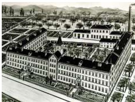
Die „Pflegeanstalt“ Straubing um die Jahrhundertwende